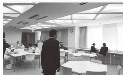
職員休憩スペース